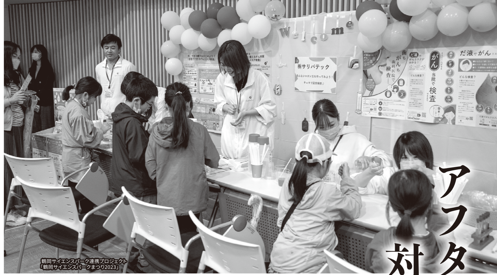
鶴岡サイエンスパーク連携プロジェクト「鶴岡サイエンスパークまつり2023」

対応し挑戦する年度と位置づけ、今回設定した「アフターコロナの事業戦略ビジョン」に基づき、会員企業の収益力向上、自己変革力を最大限発揮できるように支援に全力を上げるとともに、ポストコロナの新たな時代の地域経済ビジョンをとともに描き始める年度となるよう、鶴岡商工会議所は、地域総合経済団体として関係機関等と連携を強めながら、引き続き会員事業所及び市民への貢献、役割の発揮を目指し取り組む所存である。