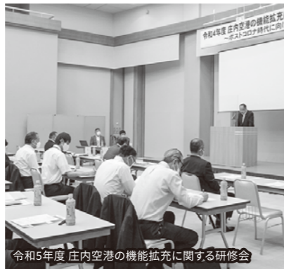
令和5年度 庄内空港の機能拡充に関する研修会

ナ明けの社会経済の大きな変化に対応していくため、各委員会・部会において、「アフターコロナの事業戦略ビジョン」を議論し設定したところであり、これに基づき①企業間連携の強化、②人手不足、2024年問題への対応強化、③脱炭素、SDGsへの具体的対応策の強化、④事業継承対策の強化、⑤空き店舗対策の強化、⑥観光振興に関する具体的戦略の強化、⑦海外輸出の強化の7項目を中期行動計画に強化項目と位置づ