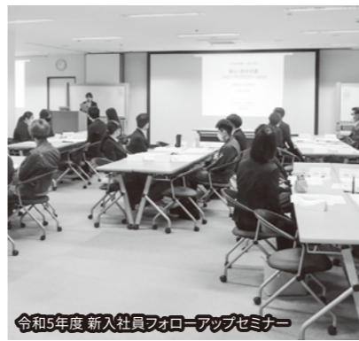
令和5年度 新入社員フォローアップセミナー

当会議所の景況調査では、令和5年4月から6月期及び7月から9月期は、コロナ禍が収束に向かい、業況、売上げ、採算及び資金繰りとも改善傾向にあったが、その後、10月から12月期は原材料価格の上昇、人手不足などの影響も受け、業種によって悪化傾向が見られた。 鶴岡・庄内地域における今後の事業経営を取り巻く環境については、原油・原材料等の高騰や、円相場の不安定化、中国経済への懸念など、依然、環境の変化が激しく、極めて予測困難な状況が続いている。併せて、コロナ明けの需要拡大もあって人材不足がさらに深刻化するとともに、年明けの能登半島地震の影響により、市内温泉宿泊施設でキャンセルが続くなど、今後の地域経済