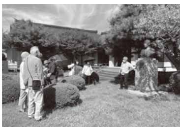
▲松山藩の要職にあり、戊辰の役で活躍した松森胤保は、学問的にも優れた人で、『日本のレオナルド・ダ・ヴィンチ』と称されている(松山観光ボランティアガイドによる案内)