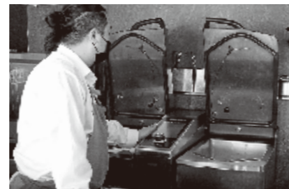
▲煮る、焼く、炒める、揚げる、茹でる、圧力調理が可能な機器をはじめ、ハイテク機器が並ぶオープンキッチン