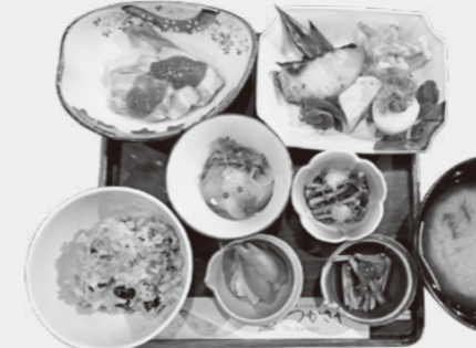
▼庄内の恵たっぷりの発酵ランチ▼