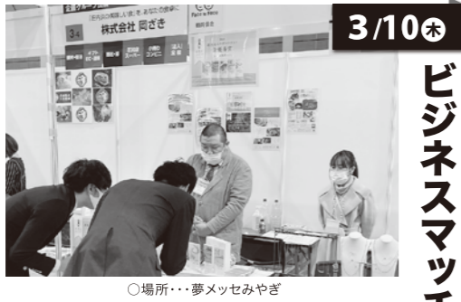
○場所…夢メッセみやぎ

会員事業所の販路開拓を目的に、東北最大級の展示商談会「ビジネスマッチ東北2022春」に、鶴岡商工会議所企画出展としてブースを確保し、当所会員4事