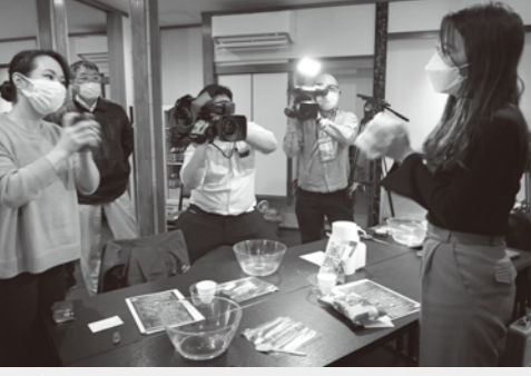
水筒の容量に応じた量の麹とお湯を入れて待つだけ。ANA SHONAI BLUE Ambassadorからも「米どころ庄内らしい、女子や親子が喜びそうな企画」と好評いただいた。

会議所では今回の検証結果を参考に、令和4年度の本格的な商品化に向けて、引き続き冬季の観光誘客強化に努めて参ります。