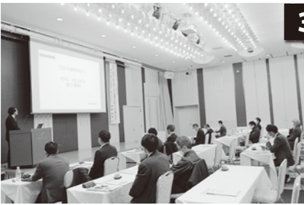
○会場…東京第一ホテル鶴岡 鳳凰の間 ○出席者数:50名(来場:30名、オンライン20名)

講演では、コロナ禍によりビジネスシーンに新たな需要が生み出され、可処分時間の増加・デジタル活用によるオンライン化が一気に促進したが、日本経済は停滞傾向であり、2030年代にはマイナ