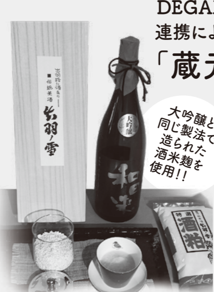
大吟醸と同じ製法で造られた酒米麹を使用!!

そして、各参加者のテーマに沿った作品は、先生からのアドバイスをいただきながらペンや紙の種類を変えるなどして、何枚も描き「満足の1枚!」が完成しました。