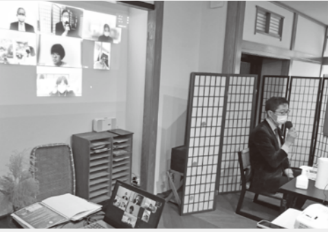
Zoomとのハイブリット開催は課題が残ったもののオンラインツアー等の新たな可能性が広がった。