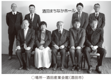
○場所…酒田産業会館(酒田市)

昨年10月にオープンしたばかりの酒田産業会館の施設を見学。後半には、両部会の活動報告ならびにコロナ禍における両市の観光の動き等について意見交換を行いました。