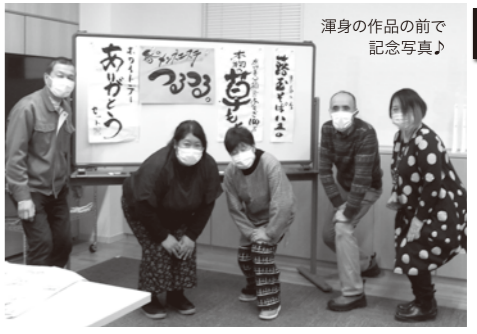
渾身の作品の前で記念写真♪