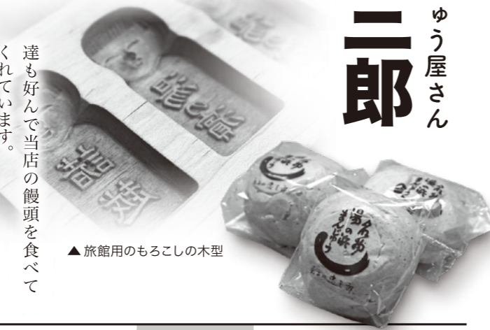
▲旅館用のもちろこしの木型

創業当時から主に和菓子を売っていました。父の代の昭和30年頃からもちろこしを作って旅館のお茶菓子として納めていました。