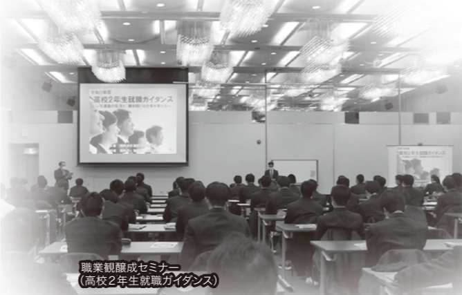
職業観成セミナー (高校2年生就職ガイダンス)