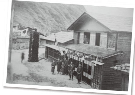
▲創業当時の「誠忠堂」