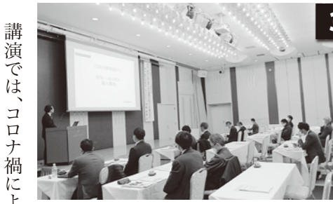
○会場…東京第一ホテル鶴岡 鳳凰の間 ○出席者数:50名(来場:30名、オンライン20名)

講演では、コロナ禍によりビジネスシーンに新たな需要が生み出され、可処分時間の増加・デジタル活用によるオンライン化が一気に促進したが、日本経済は停滞傾向であり、2030年代にはマイナ