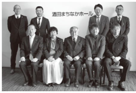
○場所…酒田産業会館(酒田市)