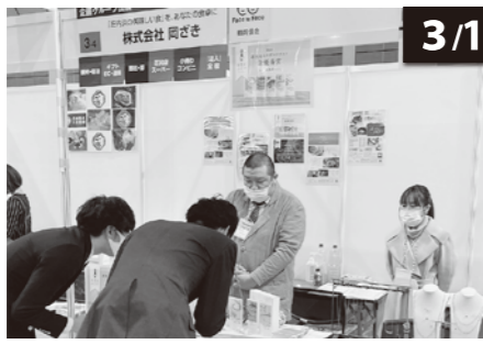
○場所…夢メッセみやぎ

会員事業所の販路開拓を目的に、東北最大級の展示商談会「ビジネスマッチ東北2022春」に、鶴岡商工会議所企画出展としてブースを確保し、当所会員4事