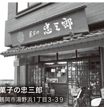
菓子の忠三郎 鶴岡市湯野浜1丁目3-39

守り続けていること 基本を大切にしながらも、創業当時とは違う自分流のアレンジにこだわって作っています。饅頭を1つ食べた後、「もう1個食べたい!」と思っていただけるよう、上質な小豆を使用し、誰からも好まれる味を目指しています。和菓子をあまり食べない子ども