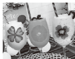
材料を変えず見せ方に工夫

コロナ禍における消費生活動向は変化しており、知らないお店に入る不安から利用経験のあるお店を選ぶ傾向が圧倒的に強くなっています。顧客管理を徹底し、従来からのお客様から何度もご利用いただく取組みが重要となります。 既存商品を変えずに、セットもの盛り合せ・インスタ映えにするなど「商品の編集により売上確保ができた事例や、季節・時間・持ち帰りなど「限定商品」の工夫、「消費者心理」を活かしたメニュー構成、コメントを書き添えた表示で「お客様の注目度」を上げる方法など、各店で