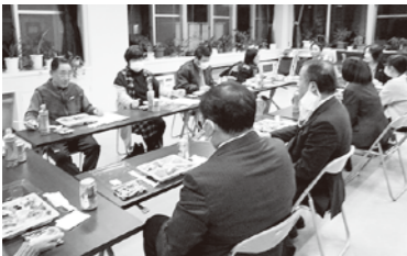
第五学区ミセンでの懇談会の様子