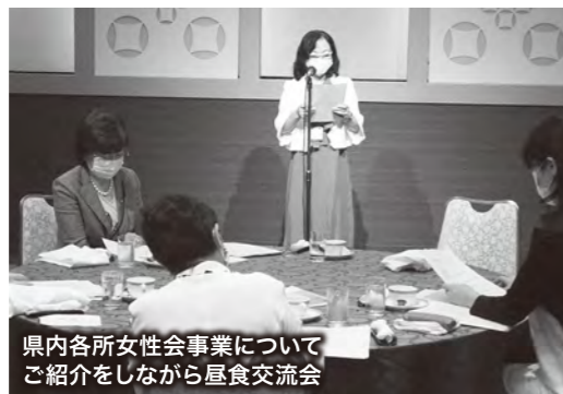
県内各所女性会事業についてご紹介をしながら昼食交流会