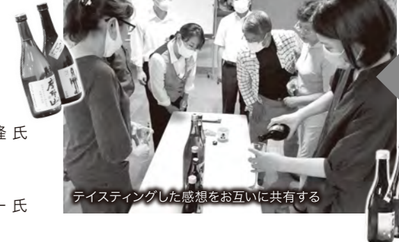
テイastingした感想をお互いに共有する

ことが大切である」と繰り返し呼び掛け、実際に7酒蔵の飲み比べを行い「感想をお互いに共有する」作業を体験しました。年代や性別によって味の感じ方に違いがあることを知り、お客様にに応じてオススメ方法を変える必要があると実感しました。 鶴岡全体で食文化創造都市としての付加価値を高めるため、本会議所では今後、本事業を4温泉から市内の飲食店へ範囲を広げ、アフターコロナにおける誘客に繋がられるよう努めてまいります。