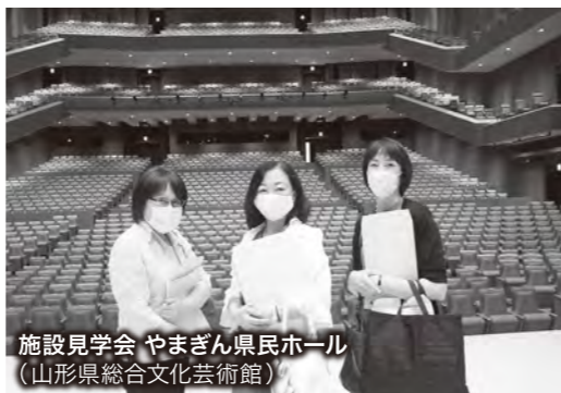
施設見学会 やまぎん県民ホール(山形県総合文化芸術館)