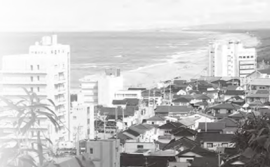
金毘羅神社から望む庄内浜の絶景に疲れも吹き飛ばす

「地元の方の話が聞けて嬉しかった」などの感想がありました。当会議所では、コロナ禍で観光客が減少している温泉地の振興支援と新たな魅力を積極的にPRし、鶴岡市全体の観光振興に繋がります。