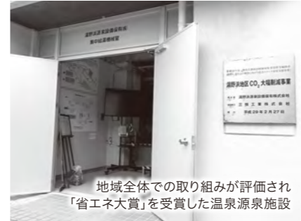
地域全体での取り組みが評価され「省エネ大賞」を受賞した温泉源泉施設

「地元の方の話が聞けて嬉しかった」などの感想がありました。当会議所では、コロナ禍で観光客が減少している温泉地の振興支援と新たな魅力を積極的にPRし、鶴岡市全体の観光振興に繋がります。