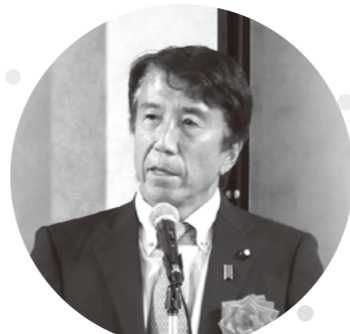
記念講演の講師齋藤健代議士

庄内地域にしていくと、式辞を述べました。続いて、加藤鮎子代議士をはじめご来賓の方々よりご祝辞を頂戴しました。式典に引き続き、前農林水産大臣の齋藤健衆議院議員が「我が国の産業経済の課題」として講演、最後に榊引地区黒川に500年の間連綿と伝承されている「国指定無形民俗文化財黒川能」舞囃子「岩船」が上演され、お祝いに花を添えていただきました。