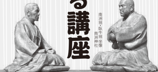
南洲翁遺訓第2版(菅家蔵)