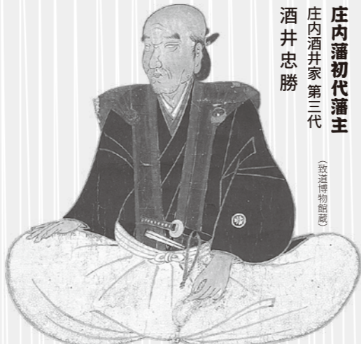
庄内藩初代藩主 庄内酒井家第三代 酒井忠勝