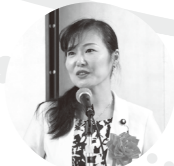
加藤鮎子代議士のご祝辞