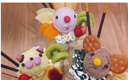
食べるのがもったいない! 動物がモチーフの可愛いパフェ

今まで通り、自分達が楽しいと思える商品を開発したいですね。より多くの人に「おやつや ゆう」を知ってもらうため、様々なイベントへの出展も検討しています。そしていつかは南国にお店を出したいです!