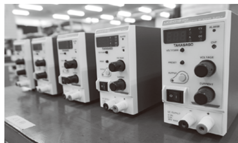
株式会社 高砂製作所 鶴岡事業所 宝田三丁目14-24 TEL.0235-23-1151

当社は、情報通信機器、自動車の開発者向け電源機器など様々な電源機器の開発・製造・販売までを行っております。市販で取り扱っている商品ではないので、イメージがつきにくいかもしれませんが、当社の商品は色々な場所で生かされています。例えば、地震が起きた際に、地震計などから測定情報を収集し関連機関へ配信したり、赤川花火大会の音源をFM派に変換し山形全土へ届けたりする通信技術などを供給しています。