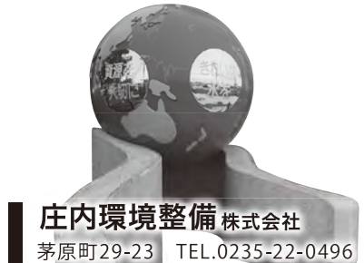
庄内環境整備 株式会社 茅原町29-23 TEL.0235-22-0496

我社では、国のもの補助支援を受け、事業所様や一般家庭で使った天ぷら油の廃油を再利用し、CO2対策として軽油に代わる環境にやさしい燃料を精製するため独自のプラントを開発しました。年間約3万リットルの精製をおこなっておりますが、更に増やしていきたいように