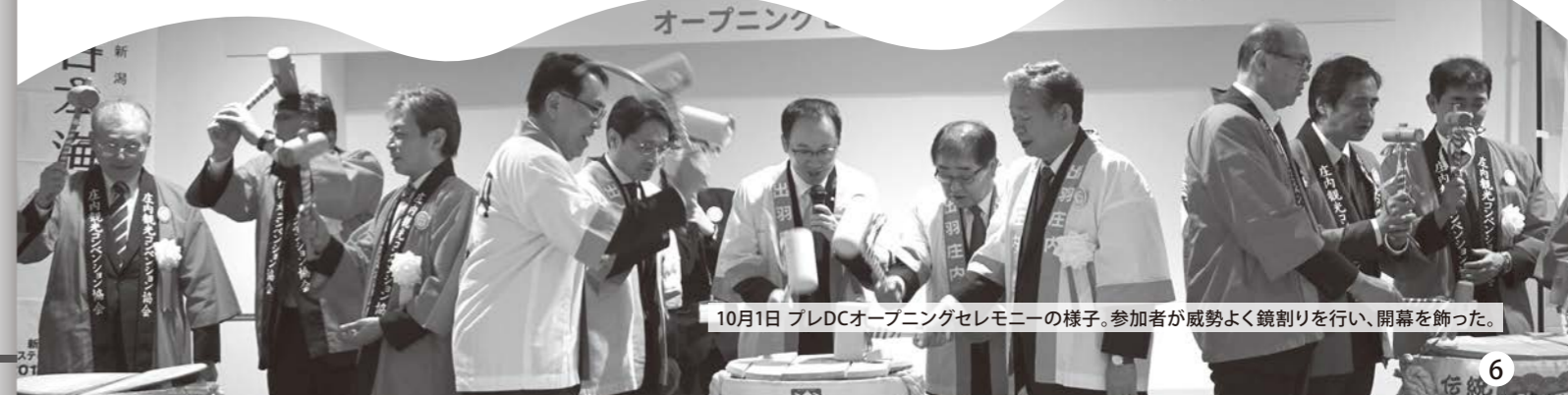
10月1日 プレDCオープニングセレモニーの様子。参加者が威勢よく鏡割りを行い、開幕を飾った。