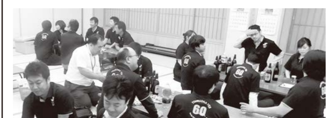
9月 例会(創立60周年記念式典に向けた勉強会)開催