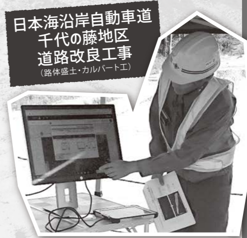
日本海沿岸自動車道千代の藤地区道路改良工事 (路体盛土・カレバート工)

まず、藤塚鷹子沼地区・南割地区工事現場にて酒田国道維持出張所建設監督官佐藤様から工事の概要・日道建設の意義の説明を受けた。藤塚鷹子沼地区は地盤が弱く、406本の杭を打ち、補強する必要があるとのこと。南割地区では、もともとある水路を日道道下に通すため函渠(トンネル)を作り、今後埋め戻す工事が施工されていた。