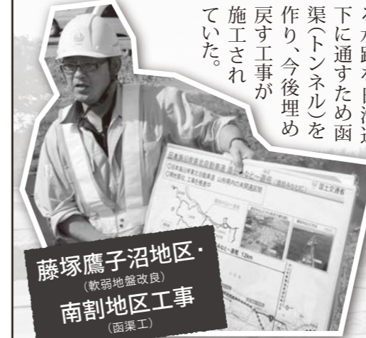
藤塚鷹子沼地区・南割地区工事 (軟弱地盤改良) (函渠工)

我が国において生産年齢人口が減少することが予想されている中、建設分野において、生産性向上は避けられない課題であり、鶴岡の建設業界においても例外ではない。国土交通省では建設現場における生産性を向上させ、魅力ある建設現場を目指す新しい取組であるICT(-Construction)を進めている。当部会ではこの度、酒田遊佐間の日本海沿岸自動車道工事において、この「ICT」を活用して工事を進めている現場の視察研修を行った。