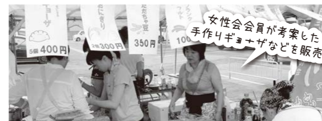
8月「荘内大祭賑わい広場」出店