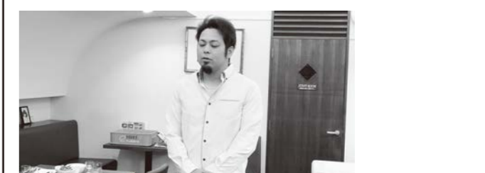
6月 例会(会員を知る勉強会)の開催