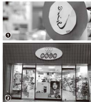
①ふで文字でディスプレイにひと工夫 ②ファサードも一新、モダンな印象に

●今後の取組や目標 お客様の美と健康のお悩みを解消し、ご満足いただける商品とサービスをリアルタイムに提供してまいります。また、お客様お一人一人に合ったご提案、化粧品の効果を感じていただける正しい使い方を伝え、キレイと笑顔のお手伝いをさせていただきます。