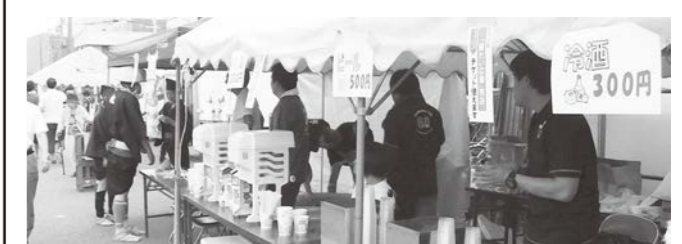
8月 荘内大祭賑わい広場の実施