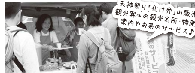
5~9月(6回実施)「おもてなし事業」実施