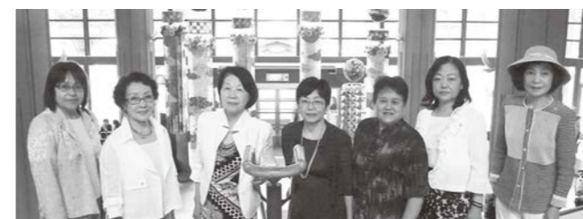
7月「東北六県商工会議所 女性会連合会総会仙台大会」参加