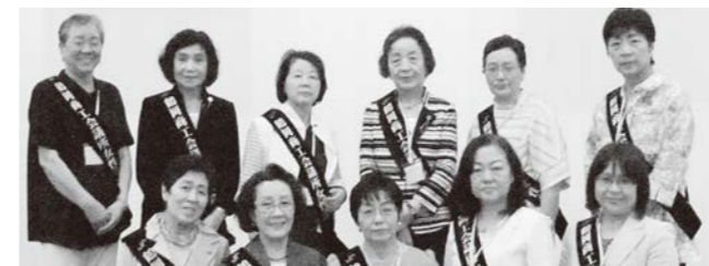
6月「山形県商工会議所 女性会連合会通常総会山形大会」参加