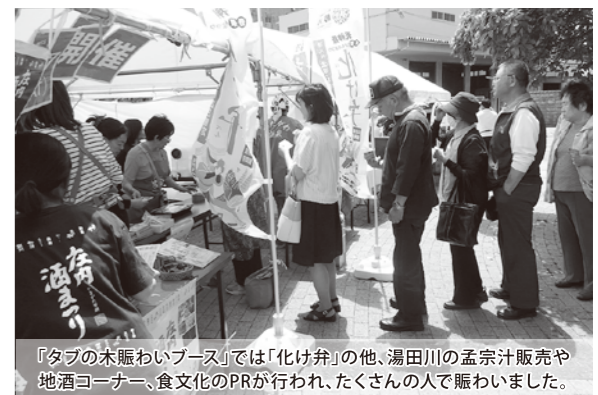
「タブの木賑わいブース」では「化け弁」の他、湯田川の孟宗汁販売や地酒コーナー、食文化のPRが行われ、たくさんの人で賑わいました。

鶴岡の天神祭「化けものまつり」の日は、おいしい料理と地酒を準備して家族や親戚が集まり、お祭りを楽しみます。当所では、その料理を気軽に味わってもらうことも