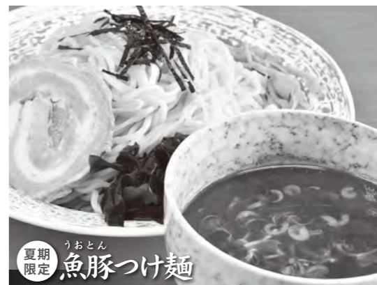
大人気「魚豚らめん」が、つけ麺として登場。カツオ仕込油と自慢のスープに甘酸っぱいタレが重なる。