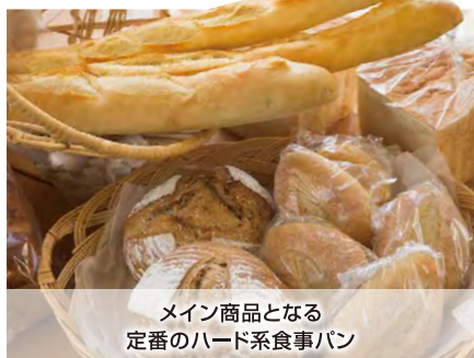
メイン商品となる 定番のハード系食事パン

鶴岡市美原町5-57 Tel.0235-23-0369 営 7:00~19:00 休 木曜・第三水曜