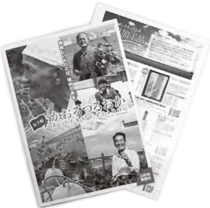
(鶴岡創造都市推進協議会・出羽商工会と連携)

鶴岡独自の食文化を紹介したバイヤー向けガイドブック「食手帳おるつるお」の企画・製作を行いました。