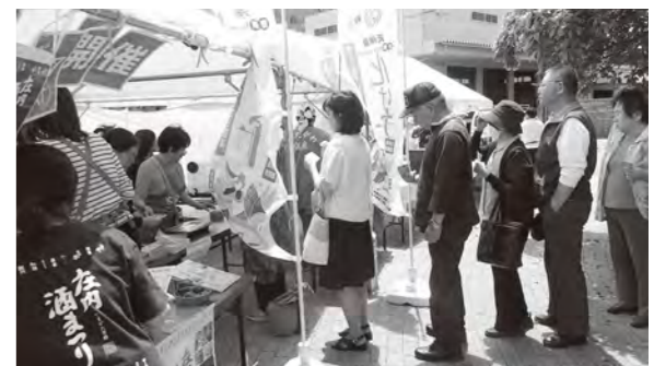
「タブの木賑わいブース」では「化け弁」の他、湯田川の孟宗汁販売や地酒コーナー、食文化のPRが行われ、たくさんの人で賑わいました。

鶴岡の天神祭「化けものまつり」の日は、おいしい料理と地酒を準備して家族や親戚が集まり、お祭りを楽しみます。当所では、その料理を気軽に味わってもらうことも