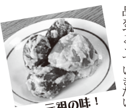
▲民田茄子からし漬 創業者の味を受け継ぎ、純からし粉だけの風味を大切に守り続けています。