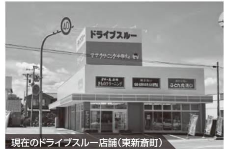
現在のドライブスルー店舗（東新斎町）

●今後の取組みや目標 これまでのサービスに加え、高齢者など来店が困難なお客様に対し、こまめに訪問サービスを行うなど一人一人のお客様の要望にお応えできるよう、スタッフ一同がんばってまいりますので、どうぞ宜しくお願いいたします。