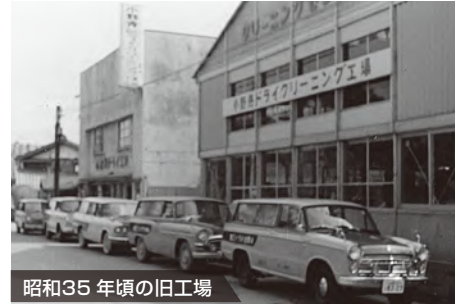
昭和35年頃の旧工場

ライフスタイルの変遷に合わせた、ドライブスルー店舗、24時間自動受付・お渡しの店、電子マネー、クレジットカード、プリペイドカードといった、多彩な店舗形態および決済手段を拡