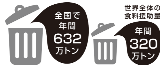
農林水産省及び環境省「平成25年度推計」

乾杯後30分は離席せず料理を食べましょう。お開き前に席にもどり残さず食べましょう。