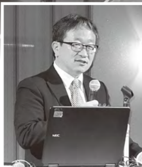
国土交通省 技監 森 昌文氏