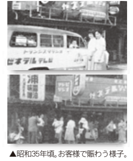
▲昭和35年頃、お客様で賑わう様子。