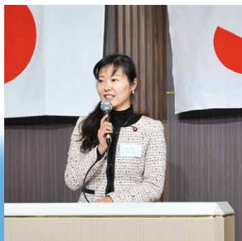
新年ご挨拶 衆議院議員 加藤 鮎子氏