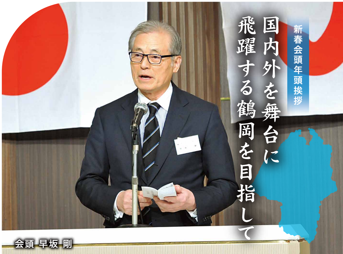
新春会頭年頭挨拶