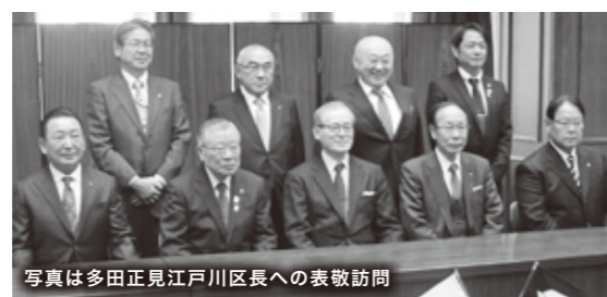
写真は多田正見江戸川区長への表敬訪問