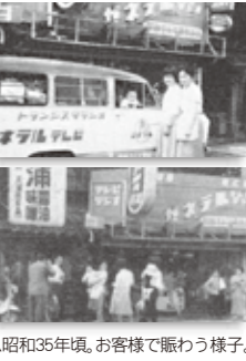
▲昭和35年頃、お客様で賑わう様子。