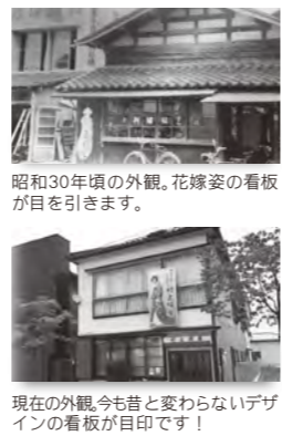
昭和30年頃の外観。花嫁姿の看板が目を引きまます。 現在の外観。今も昔と変わらないデザイン。看板が自印です！

●技術の伝承 高校卒業と同時に、京都の紋書店で7年間、東京で3年間しみ抜き修行し、30歳を前に帰郷。家業に就きました。紋入れの手順としては、まず刷り込みから始めます。紋に合わせた型を作り、切り抜かれた部分に染料で染色、その後筆を使って墨で細かな部分を慎重に書いていきます。一番難しい工程は、染料を着物と同じ色に合わせることで、高度な作業が要求されますが、今までの経験を活かして丁寧な仕上げをしています。家紋の紋入れ以外の仕事も多く、お客様のニーズに合わせて、着物の金箔直し、着物の補修に関わることを、幅広く行なっています。一級染色補正技能士の資格を取得していますので、何かお困りのことがございましたら、お気軽にご相談ください。