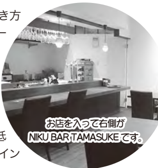
お店に入って右側がNIKU BAR TAMASUKEです。

●お店の紹介 昨年9月に、肉の厚さや切り方・挽き方などの要望にお応えする、細かいサービスの出来る店を目指し開業。実家の養豚業が「庄内こめ豚」をブランド化するタイミングとも重なり、積極的にアピールしています。店舗内のNIKU BAR TAMASUKEは、週末限定の予約制。肉屋だからできる低価格で、品質の確かなステーキをメインにしたお食事を提供しております。