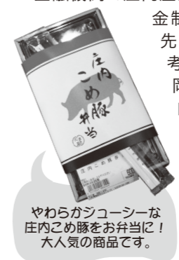
やわらかジューシーな庄内こめ豚をお弁当に！人気の商品です。

●これからの目標 開業から1年足らずなので、当初の事業計画を確実にクリアしていくため日々努力しております。多くのお客様にご来店いただけるよう、今後もおいしいお肉の食べ方や惣菜の新メニューなど、新しい提案をしていきたいです。