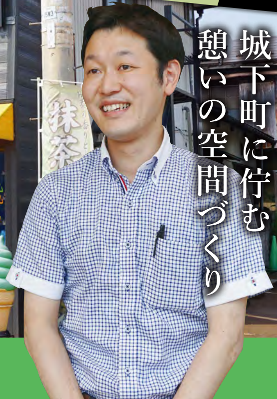
小規模事業者持続化補助金を活用して店頭とメニューをリニューアル