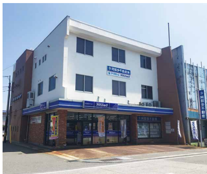
▲阿部多不動産株式会社