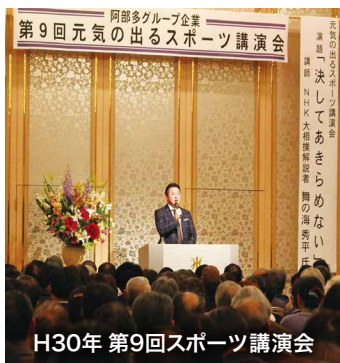
H30年 第9回スポーツ講演会