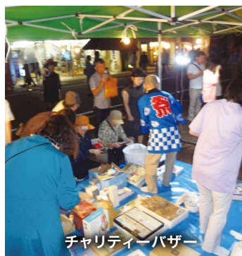
チャリティーバザー